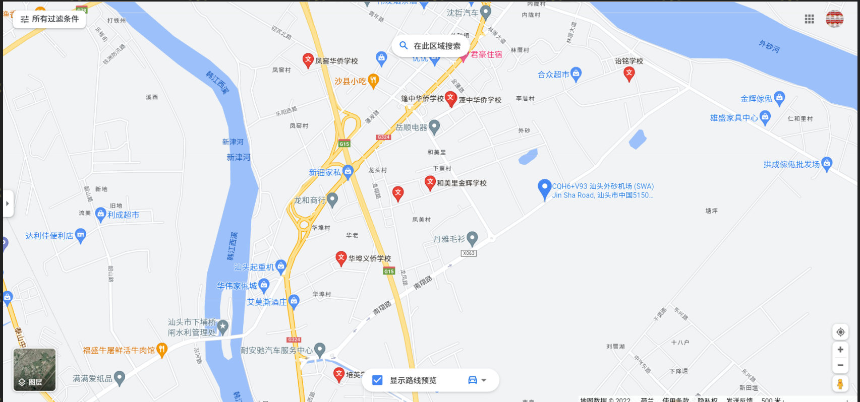
Punto rojo: ubicación de escuelas